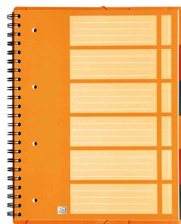
Indexblatt - 6 Taben zur Organisation