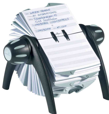
TELINDEX® flip Adresskartei, schwarz / grau