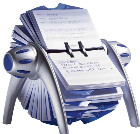
TELINDEX® flip Adresskartei, metallic-silber / blau