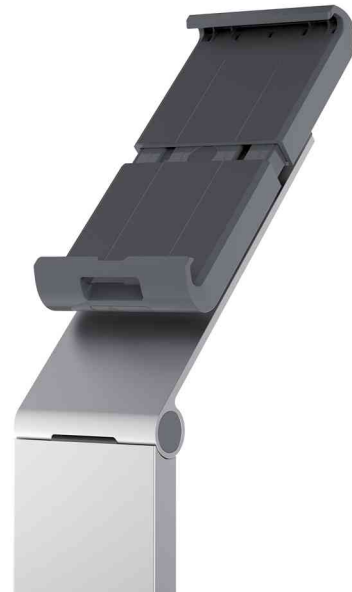
Tablet-Bodenständer "TABLET HOLDER FLOOR", Detailansicht