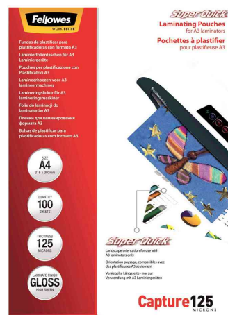
Laminierfolientaschen Super Quick, 250 mic