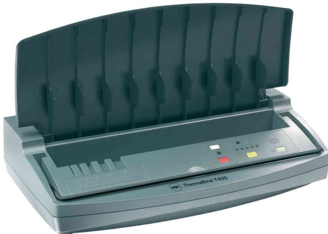
Thermobindegerät ThermoBind T400