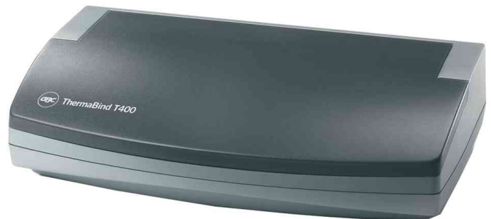
Thermobindegerät ThermoBind T400, geschlossen