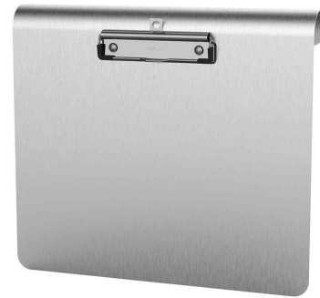
Klemmbrett MAULmedic, Querformat