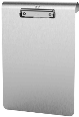
Klemmbrett MAULmedic, Hochformat