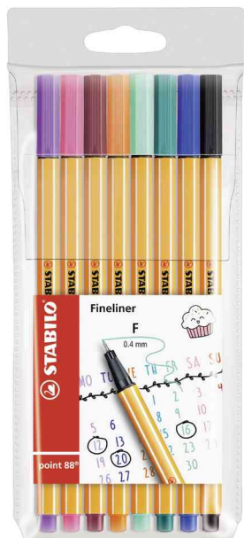
Fineliner point88®, 8er My STABILO Journal-Etui