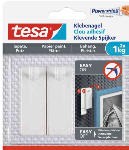
Powerstrips® Klebenagel - für Tapete & Putz, 2 x 1 kg