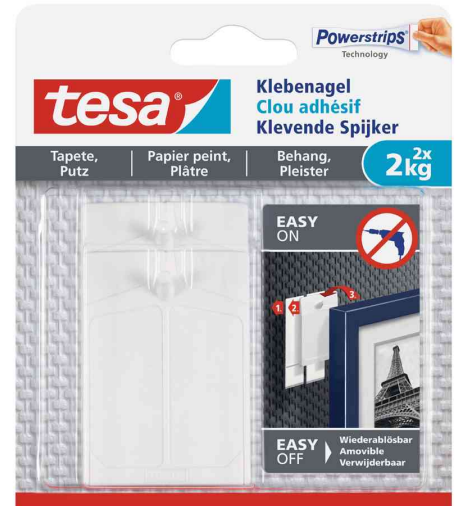
Powerstrips® Klebenagel - für Tapete & Putz, 2 x 2 kg