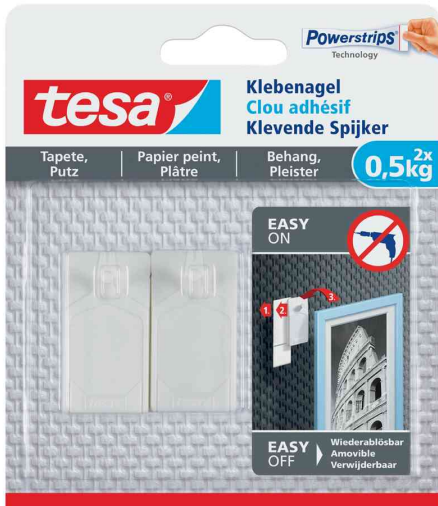
Powerstrips® Klebenagel - für Tapete & Putz, 2 x 0,5 kg