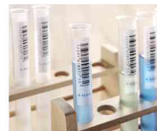
Power Etiketten SPECIAL, Anwendung