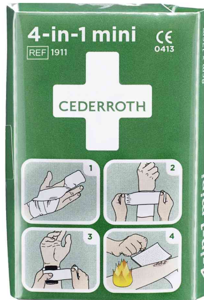
4-in-1 Blutstillter-Verband, mini