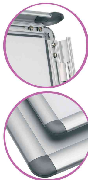
Detailansicht: hochklappbarer Rahmen